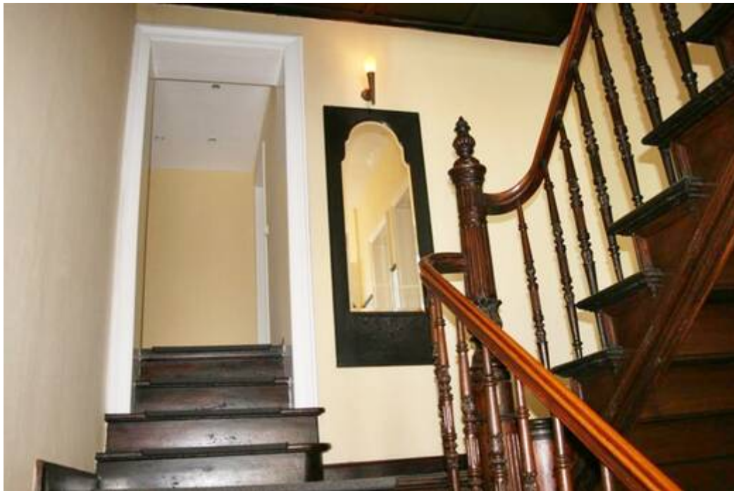
Treppe ins OG