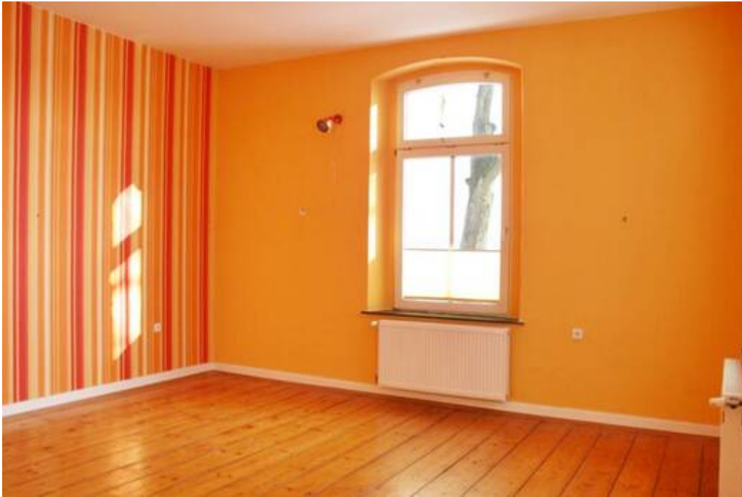
1 von 4 Schlafzimmern