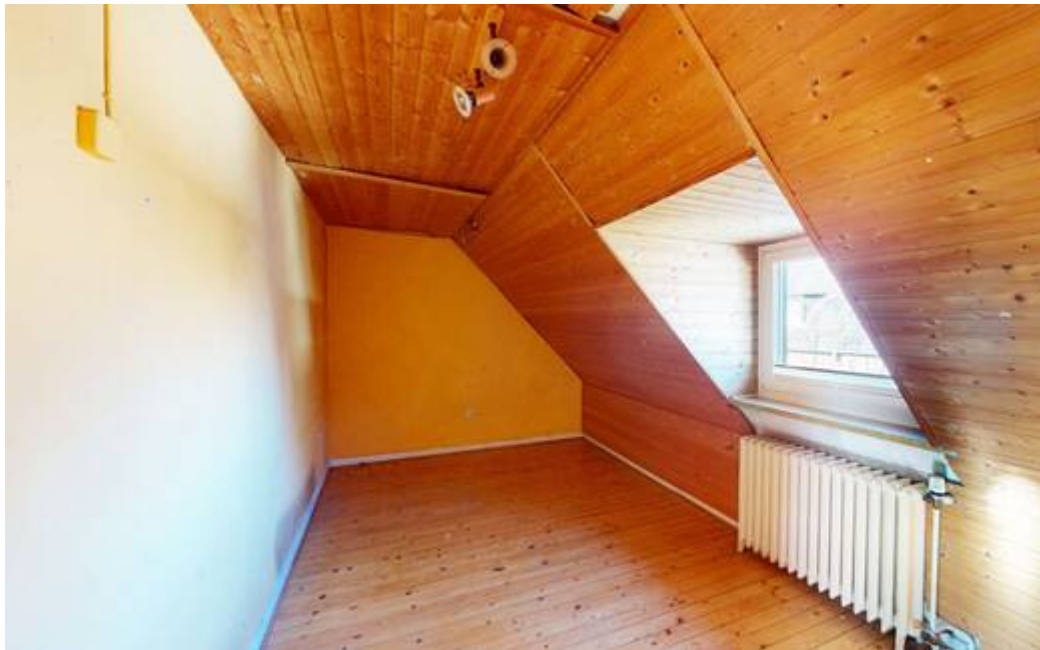
Zimmer VI DG