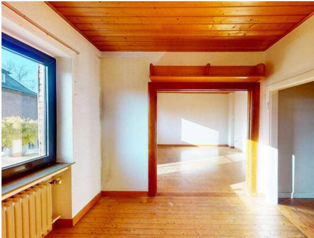
Wohn- & Esszimmer