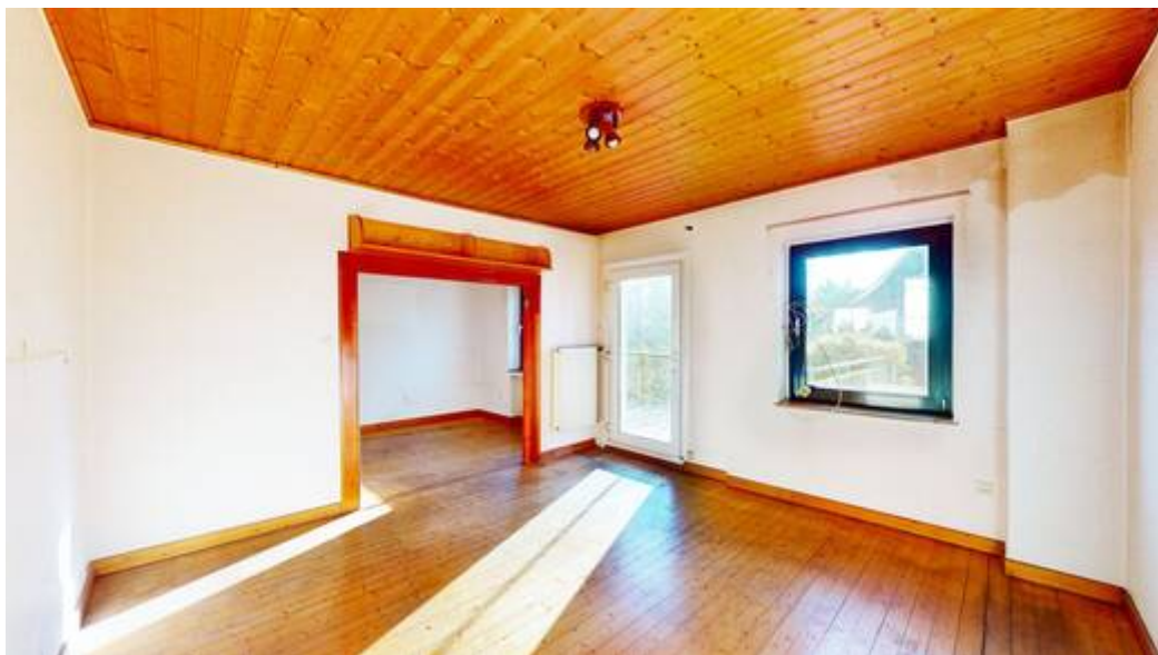
Wohn- & Esszimmer