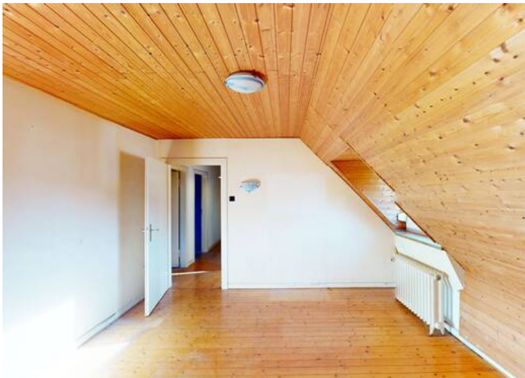
Zimmer VII DG