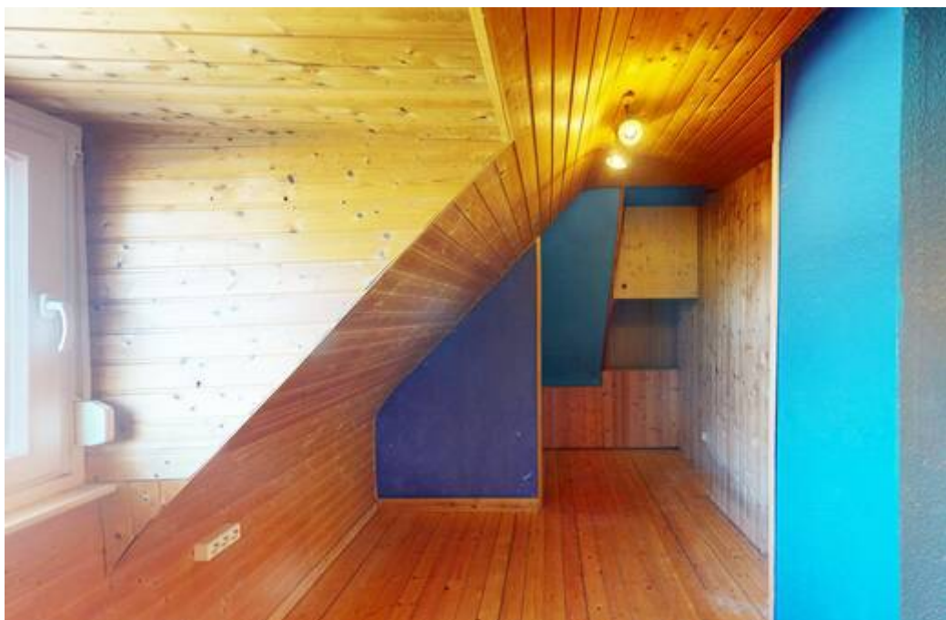
Zimmer V DG