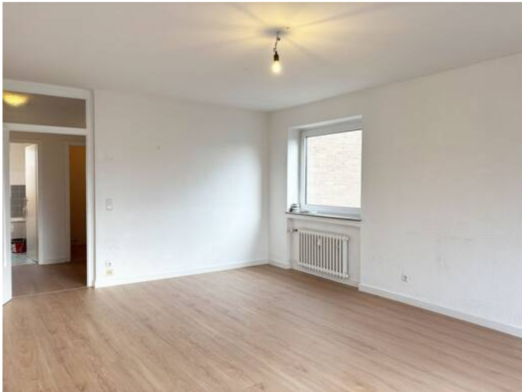
Wohn- & Esszimmer