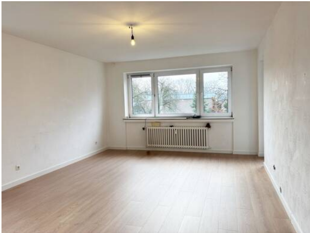
Wohn- & Esszimmer