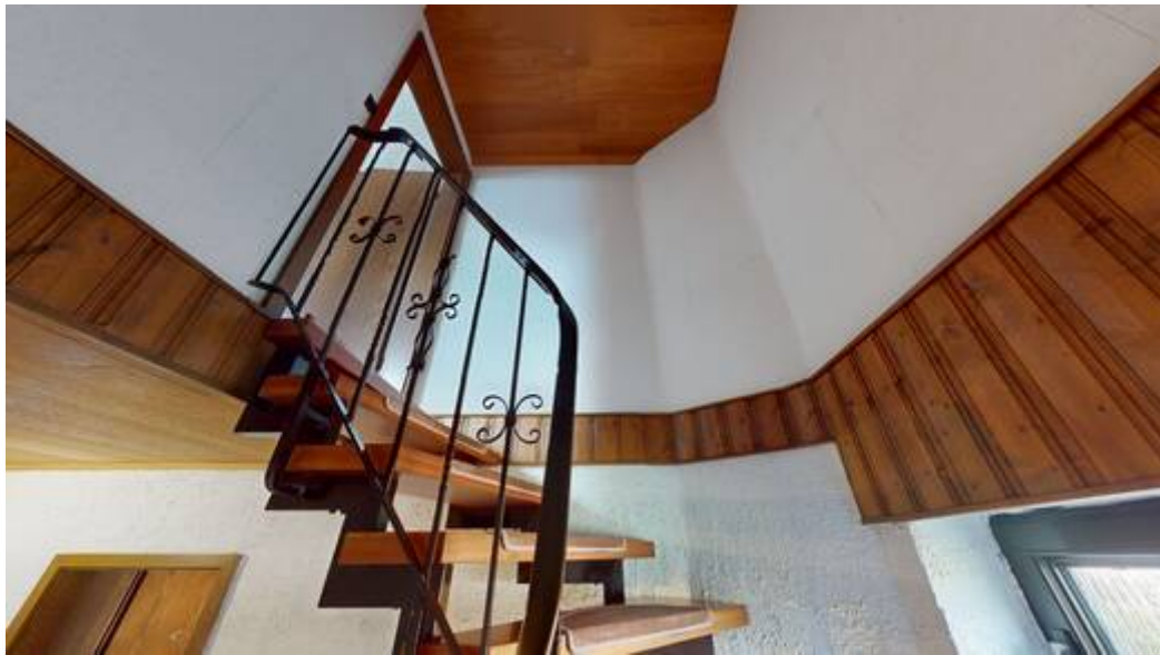
Weg ins Dachgeschoss