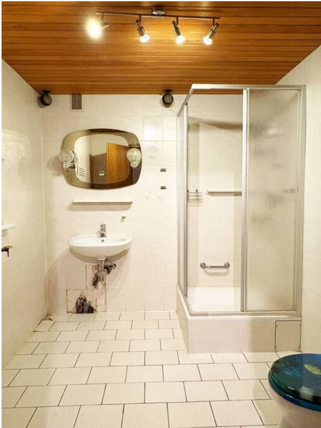
Bad im Keller