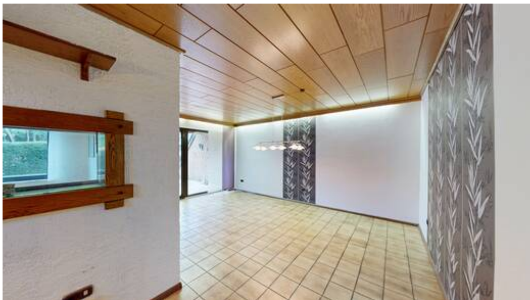
Blick in den Wohn-/ Essbereich