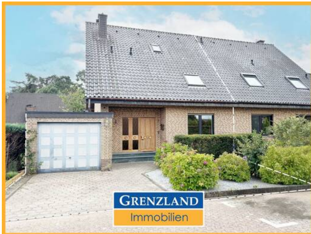
DHH in Mehrhoog