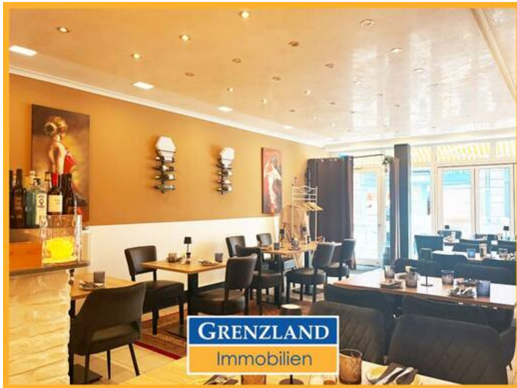
Gastro-Gewerbe mit Terrasse