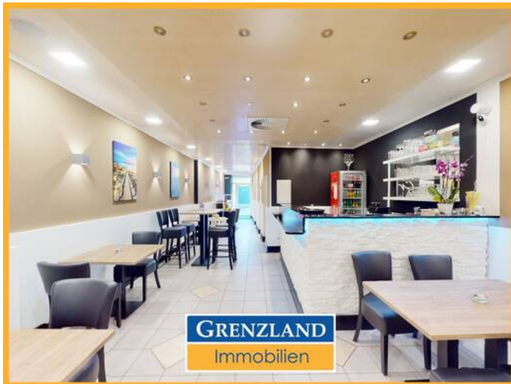
Gastro-Gewerbe mit Terrasse