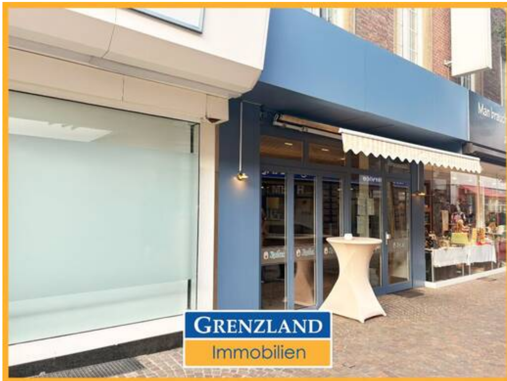
Gastro-Gewerbe mit Terrasse