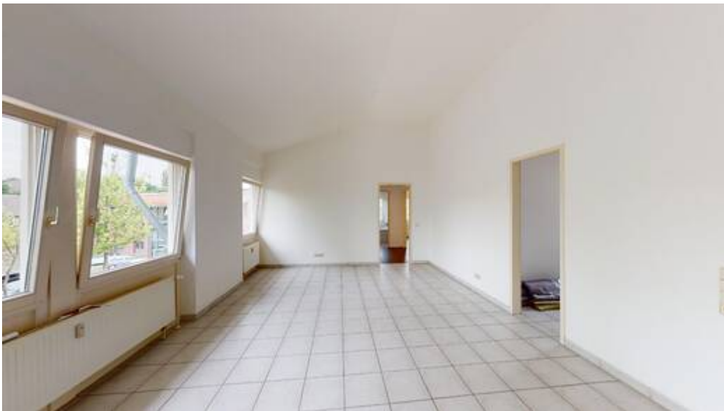
Wohn- & Essbereich