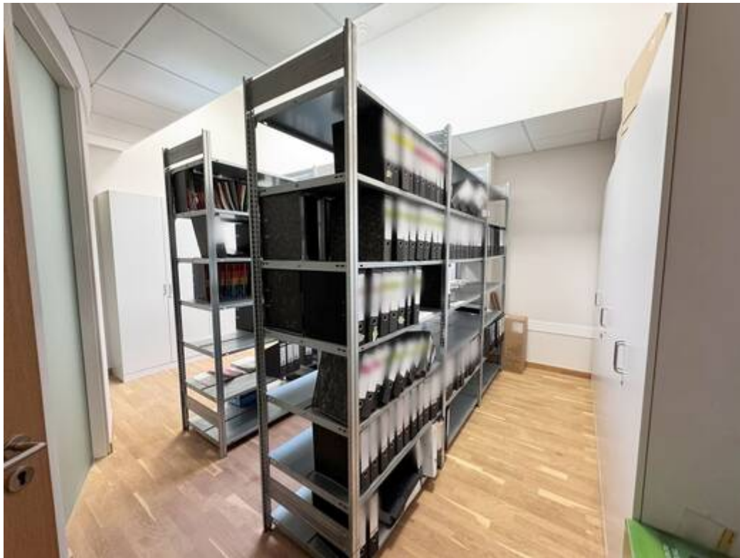
Archiv mögl. Büro