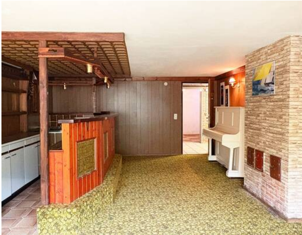
Partyraum im Keller