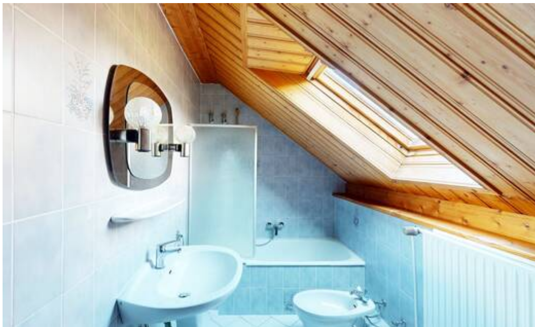
OG: Badezimmer II von II