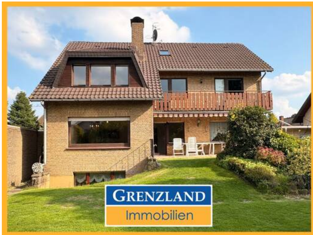
Bezugsfreies Zweifamilienhaus in Haltern