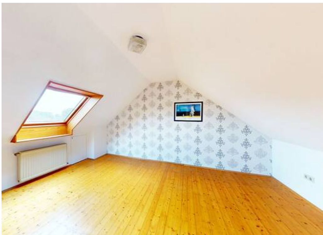
Schlafzimmer im Spitzboden