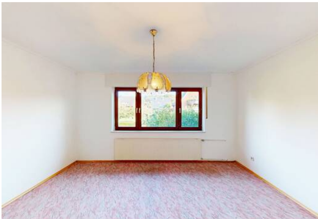
Schlafzimmer I von II