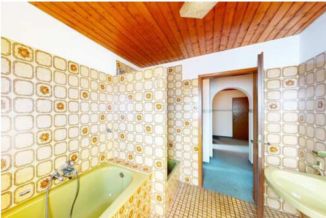
OG: Badezimmer I von II