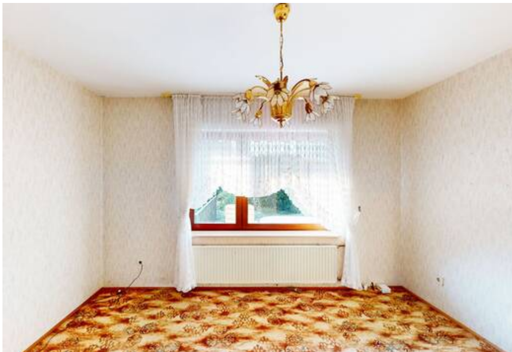
Schlafzimmer II von II