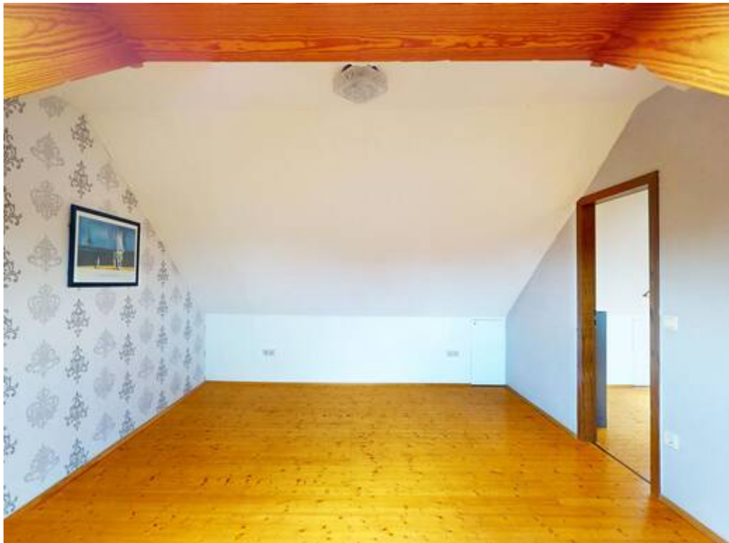
Schlafzimmer im Spitzboden