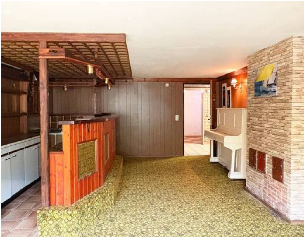
Partyraum im Keller