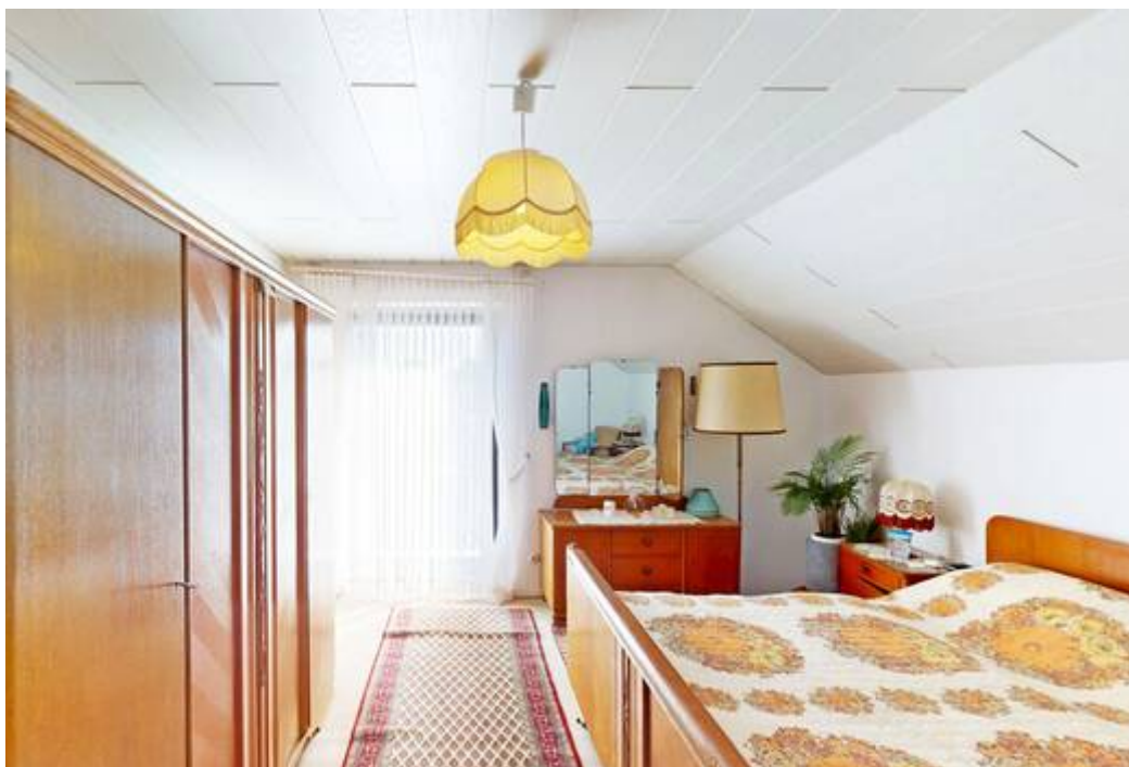
2 Schlafzimmer OG