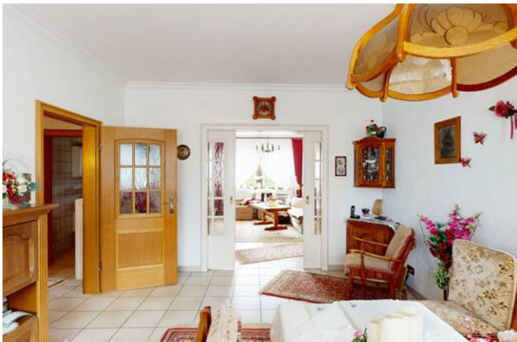
Wohn- & Essbereich