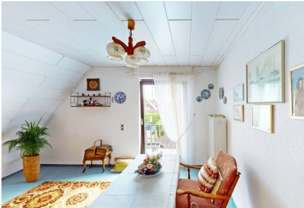
1 Schlafzimmer OG