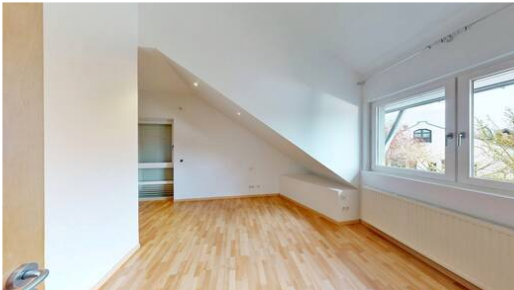
Schlafzimmer I von III