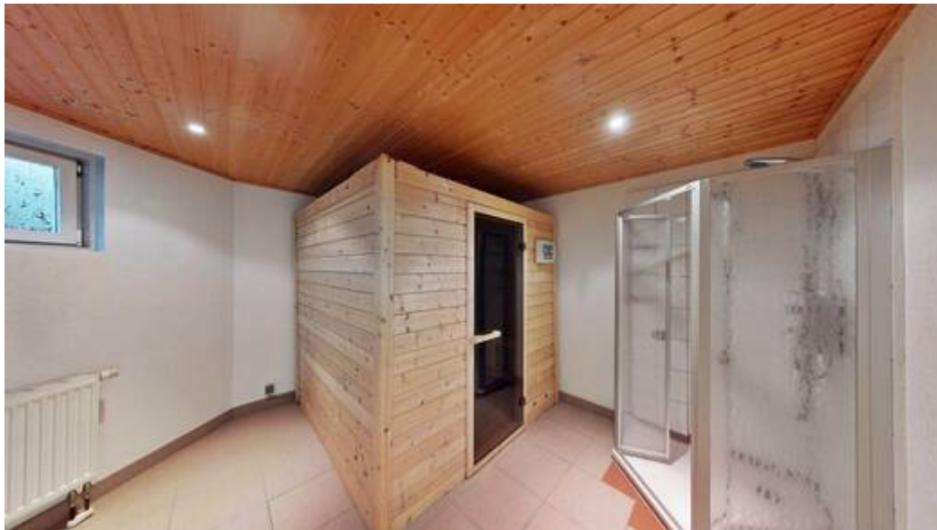
Sauna im Keller