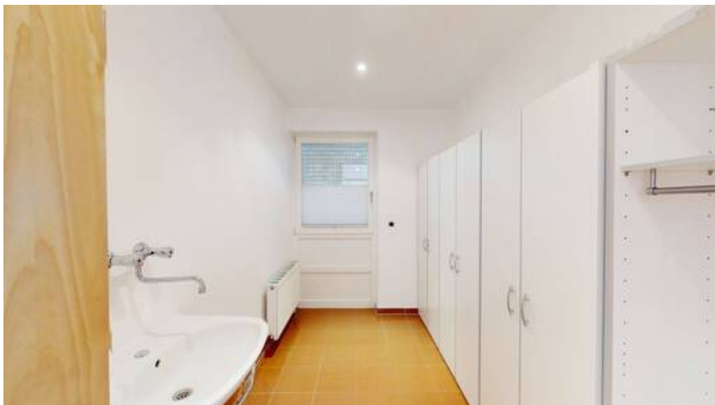
HWR im EG