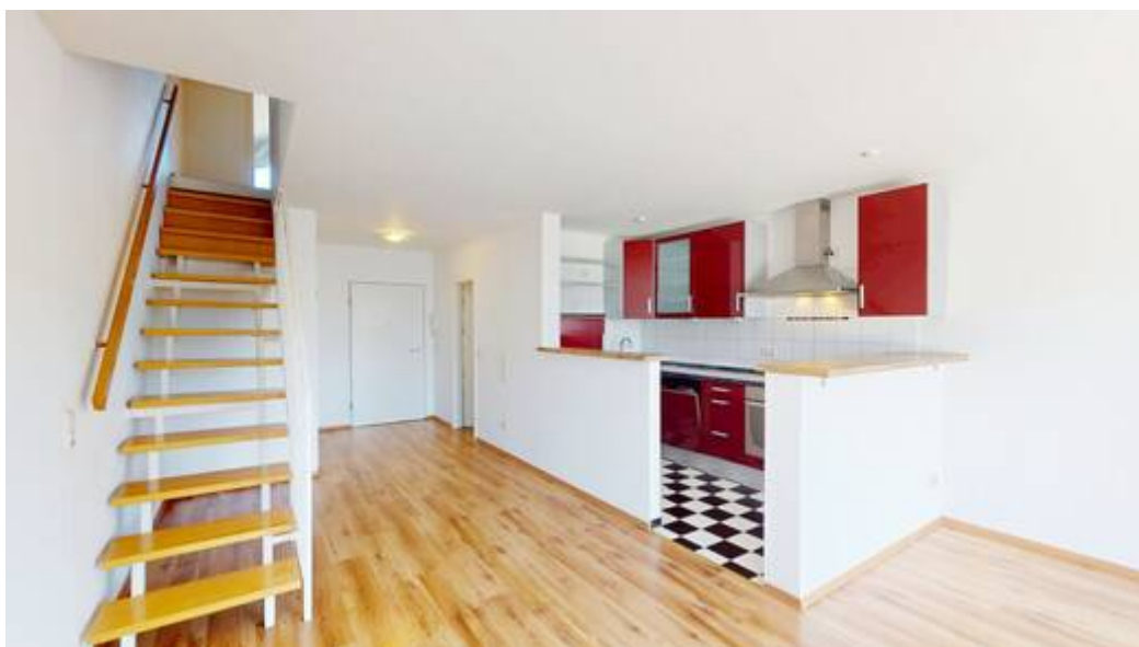
Wohn- & Essbereich