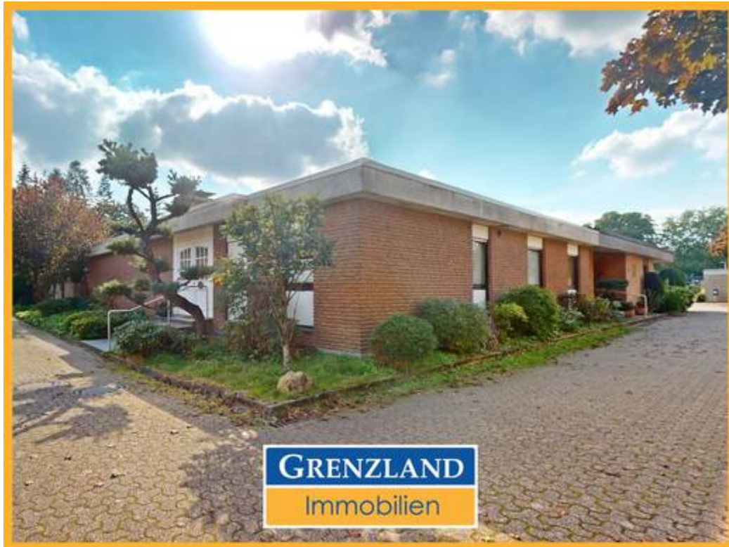
Bungalow in Bocholt