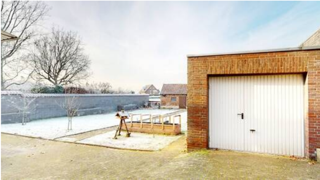
Garage und Garten