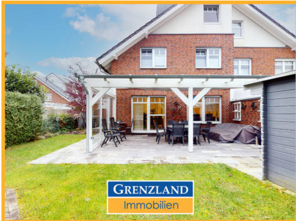
Doppelhaushälfte in Isselburg