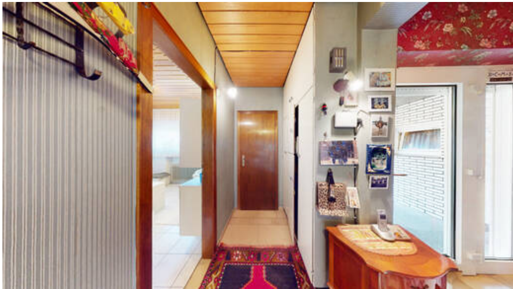
Wohneinheit I: Diele