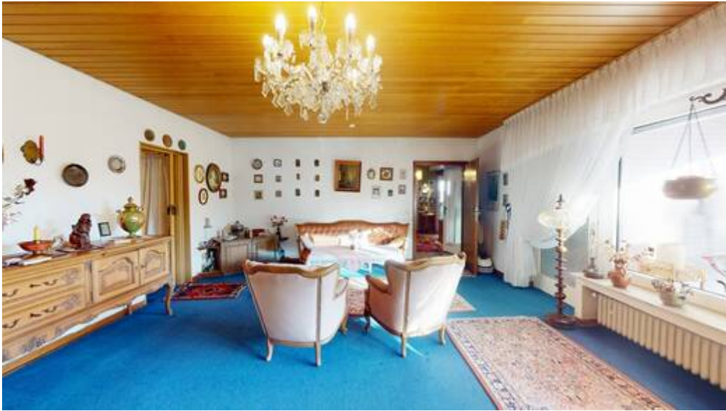
Wohneinheit I: Wohn-/Essbereich