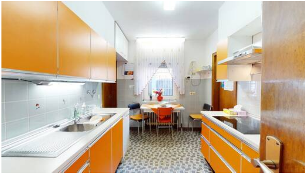
Wohneinheit I: Küche