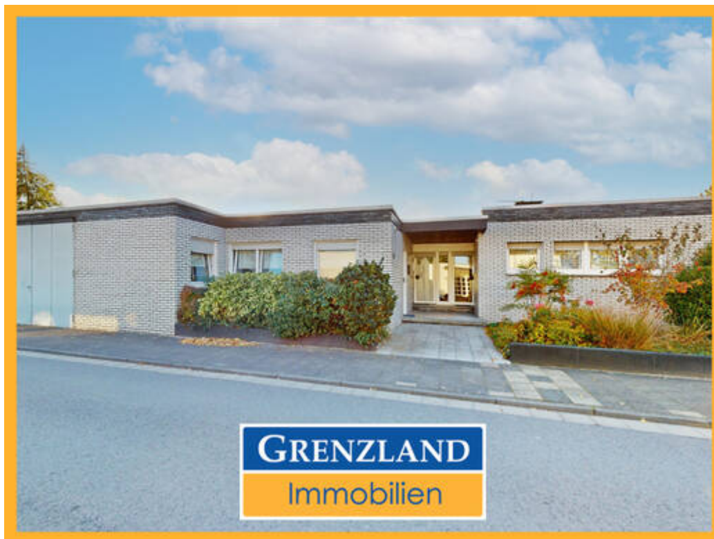
Bungalow mit 3 Wohneinheiten