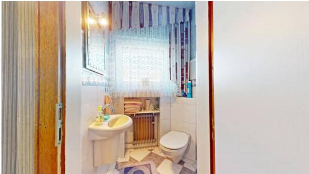
Wohneinheit I: Gäste-WC