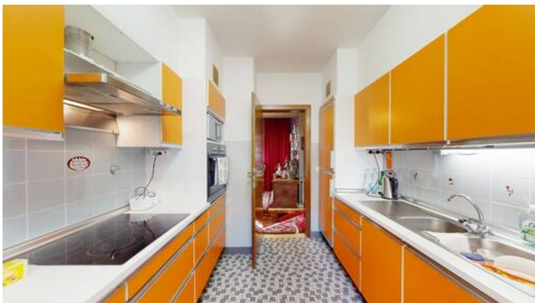
Wohneinheit I: Küche