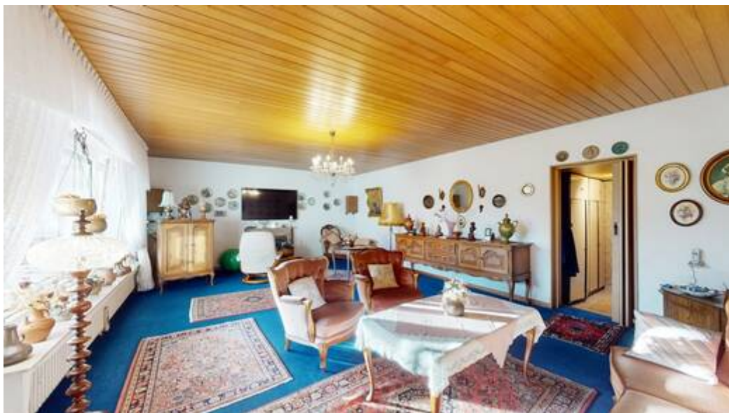
Wohneinheit I: Wohn-/Essbereich