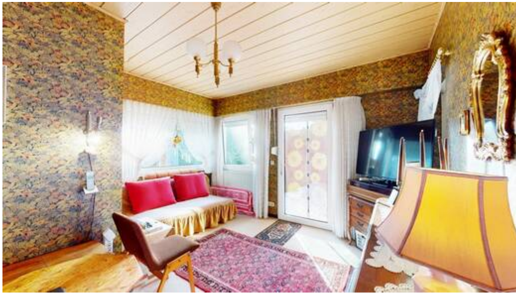
Wohneinheit I: Schlafzimmer