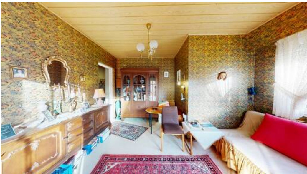
Wohneinheit I: Schlafzimmer