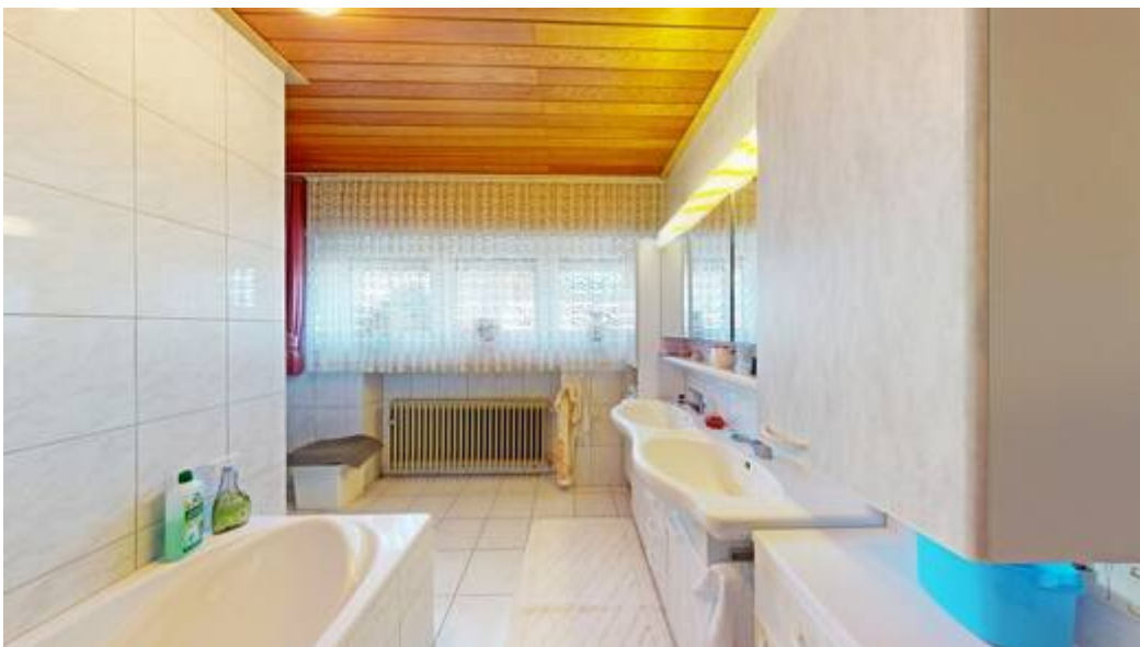
Wohneinheit I: Badezimmer