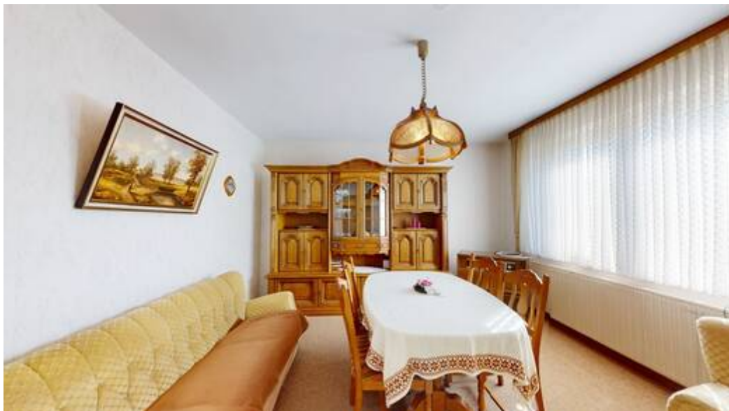
EG: Zimmer I von III