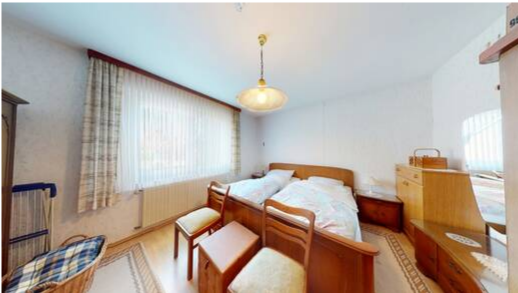
EG: Zimmer III von III