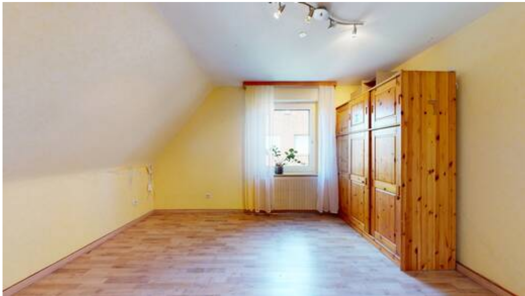
OG: Zimmer I von III