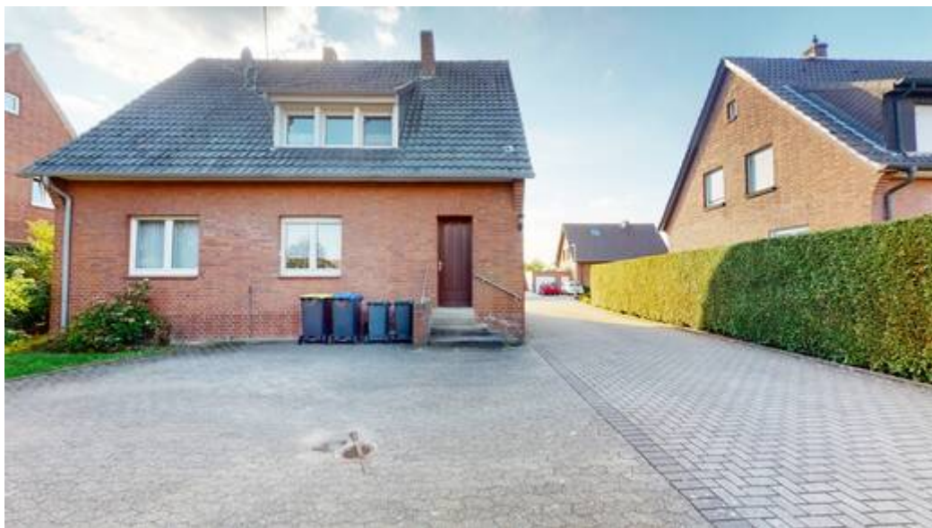
Rückansicht des Hauses