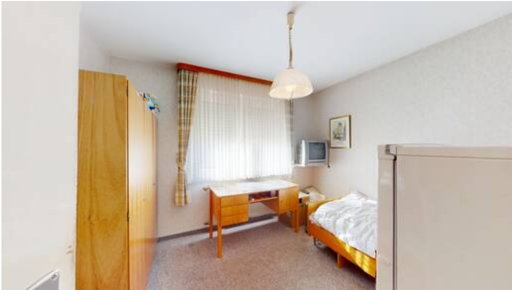
EG: Zimmer II von III