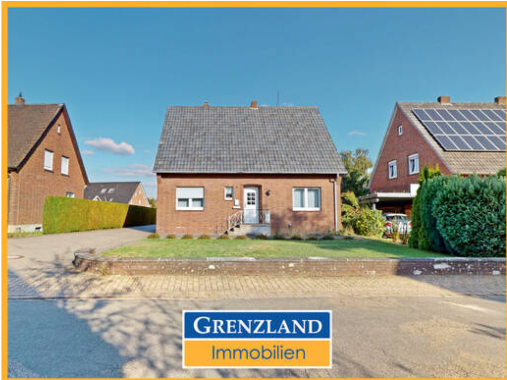
freistehendes Einfamilienhaus in Werth