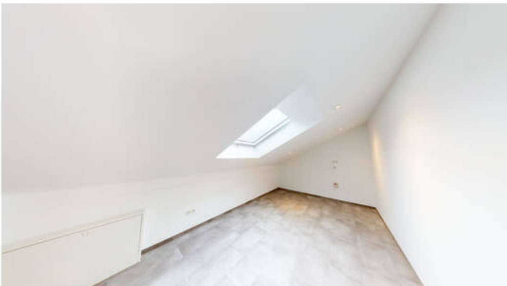
Zimmer III 8 Meter Länge