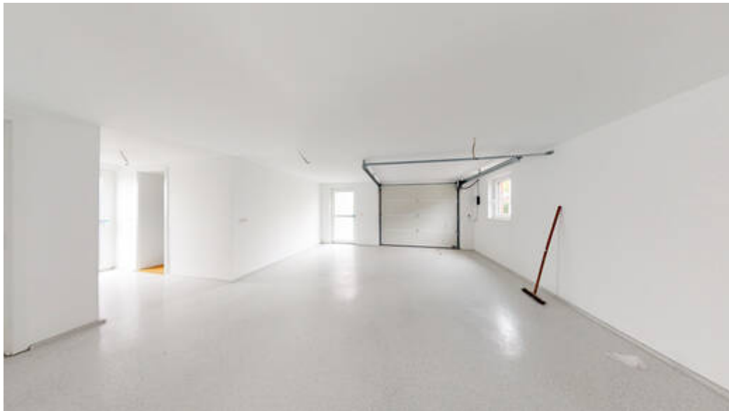
Garage mit Hauszugang