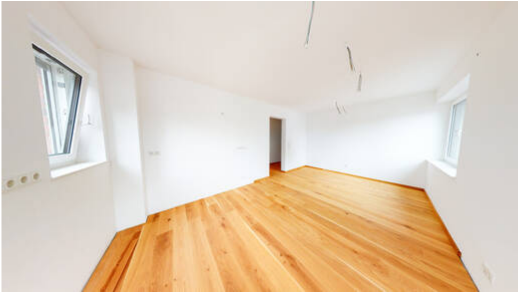
Freiraum für ihre Einbauküche