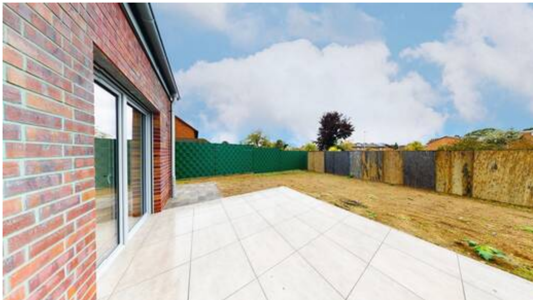
Garten mit Terrasse