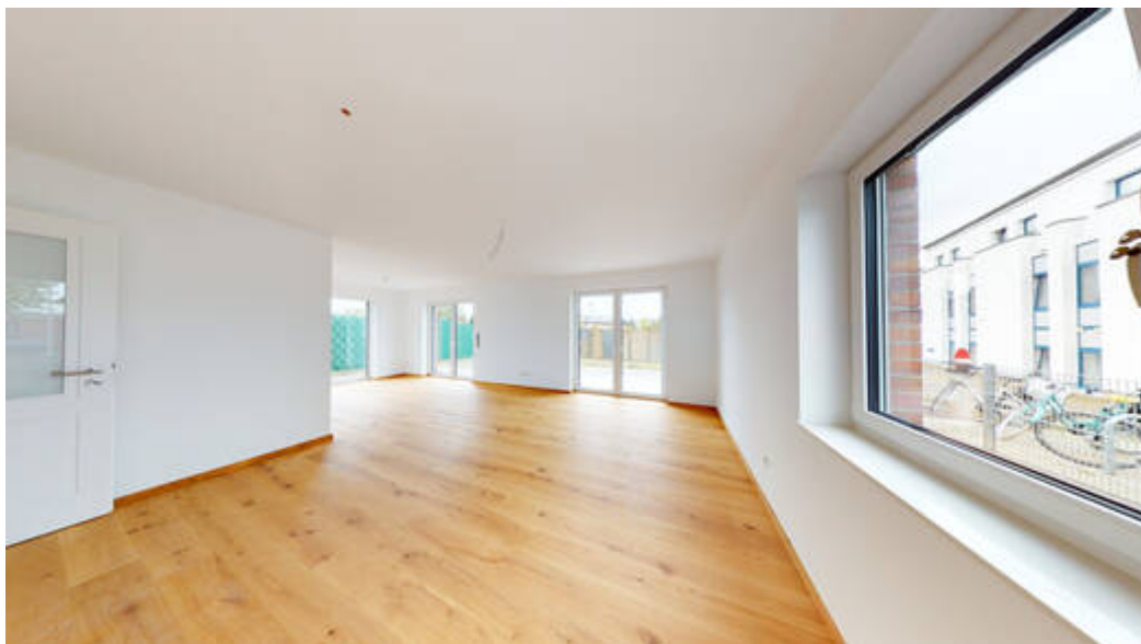
Wohnzimmer mit Essbereich