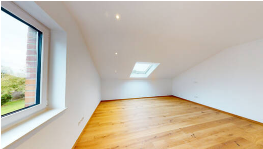
Schlafebene - Zimmer I