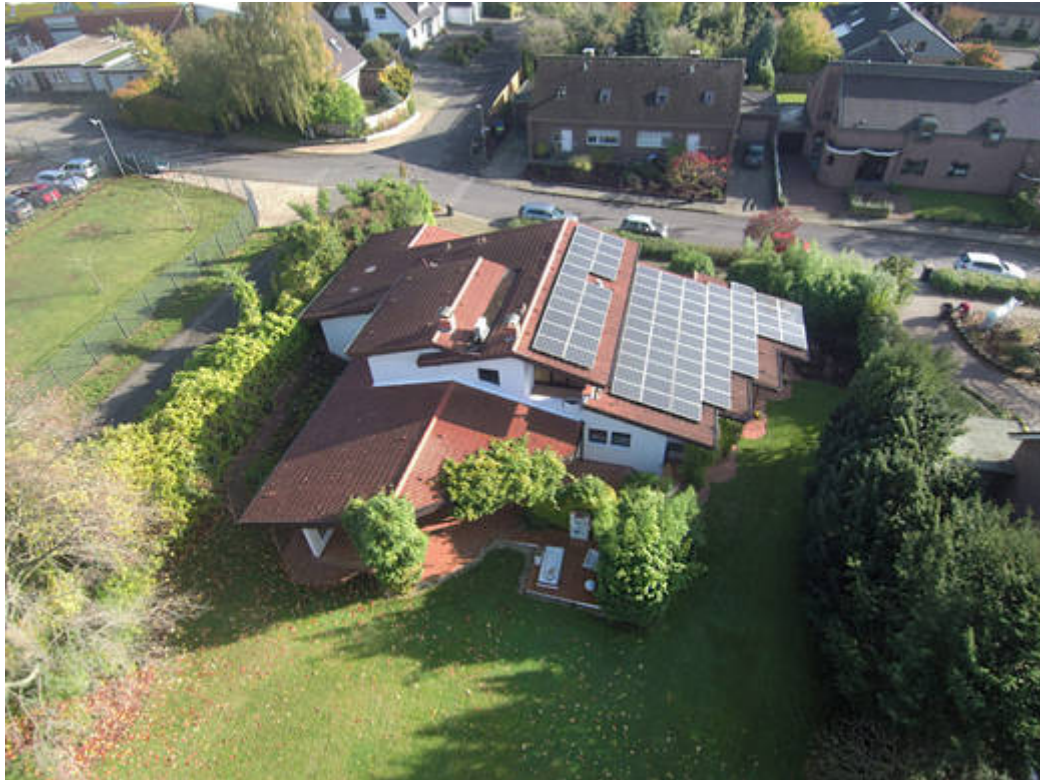
Architektenhaus-Luftansicht - Kopie