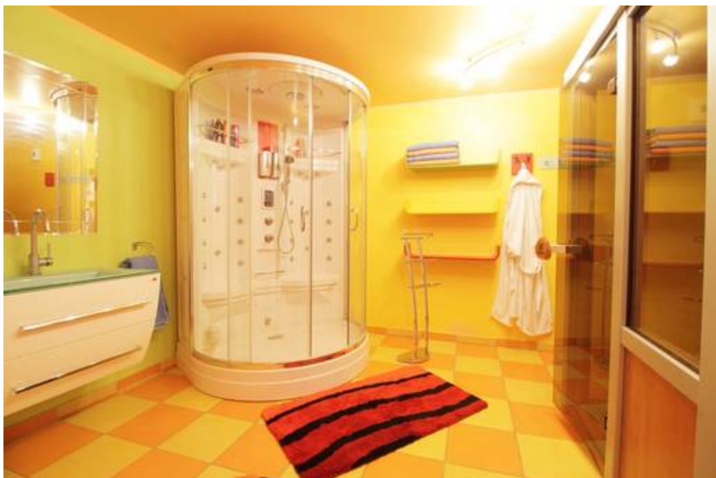
Wellnesbereich mit Sauna