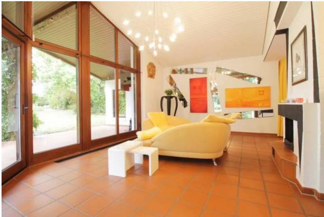
Wohnen mit Kamin