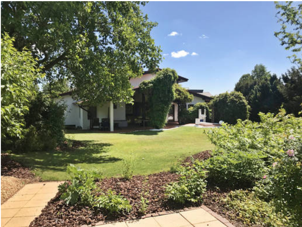
Gartenlandschaft - Südlage