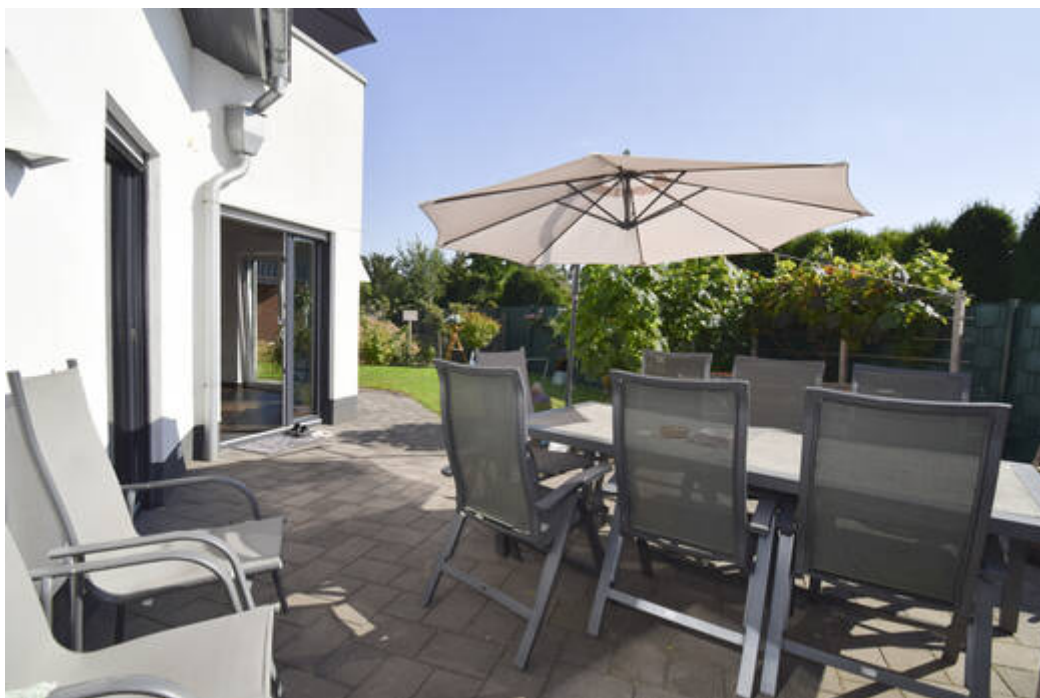
Garten mit Sonnenterrasse