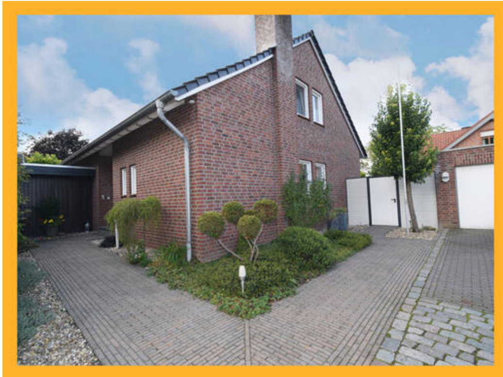
ImmoScout Maske schmal