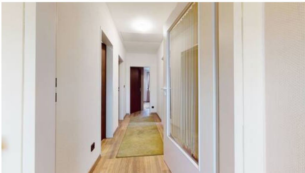
Flur im Obergeschoss