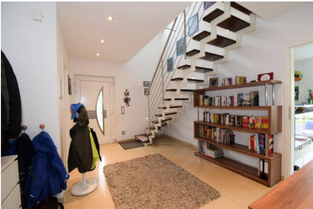
Gelungener Auftakt gelingt durch die Eingangsdiele