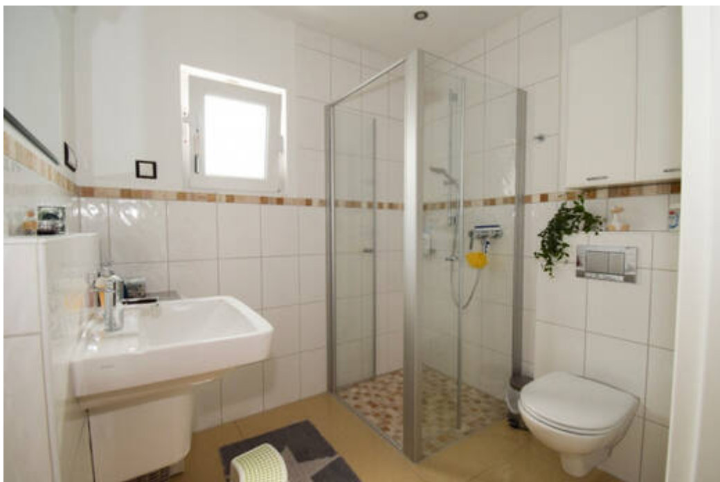
Designer-Bad mit Walk-In-Dusche im Erdgeschoss