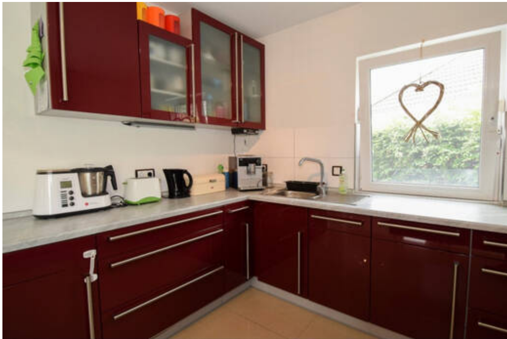
Die hochwertige Einbauküche ist im Kaufpreis enthalten