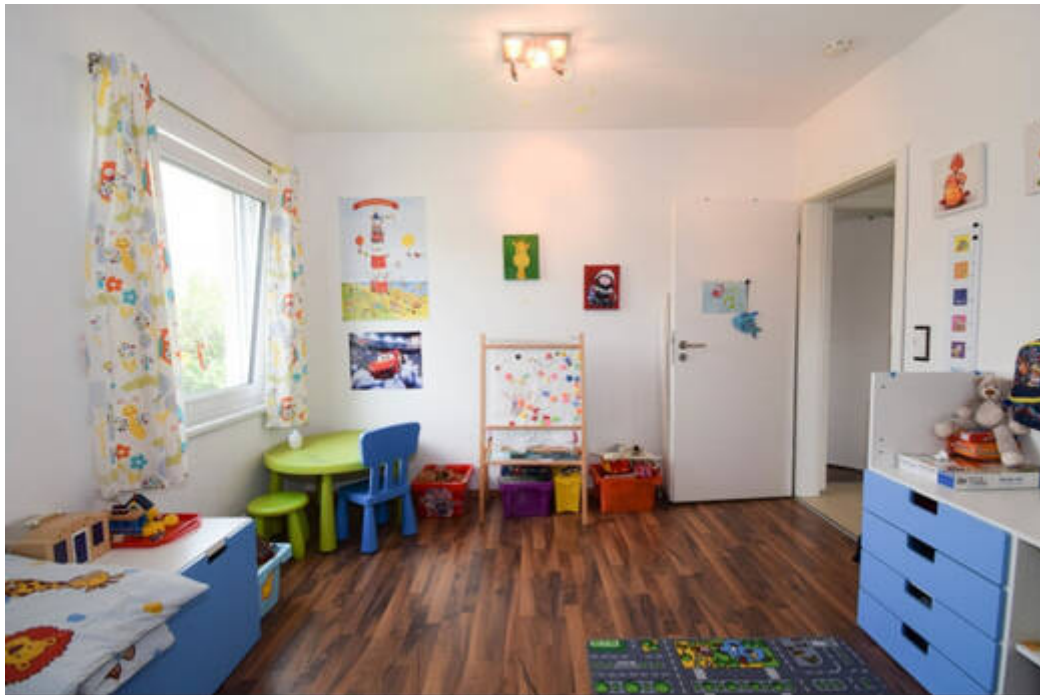
DG: Erstes Kinderzimmer - Kreativität werden keine Grenzen gesetzt