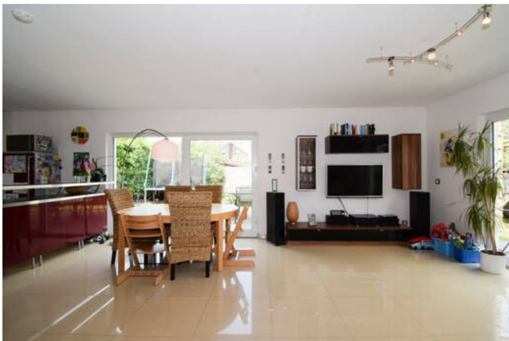
Familienzentrum - Offene Raumgestaltung