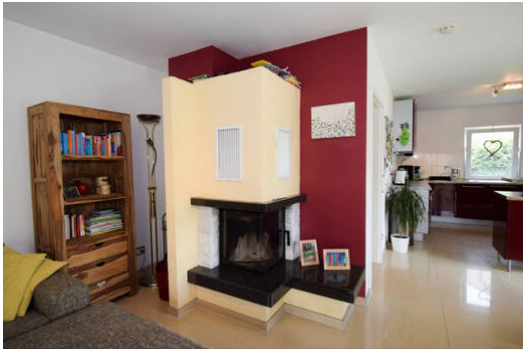
Wohlige Wärme verspricht der stilvolle Kamin