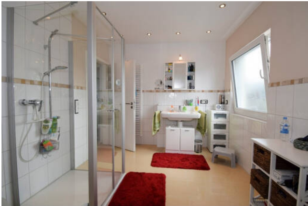
DG: Tageslichtbad mit Bewegungsfreiheit