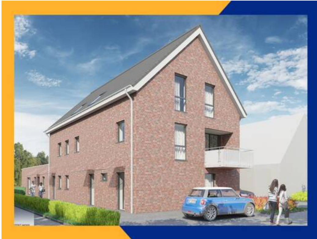
Maisonette-Wohnung mit Loggia