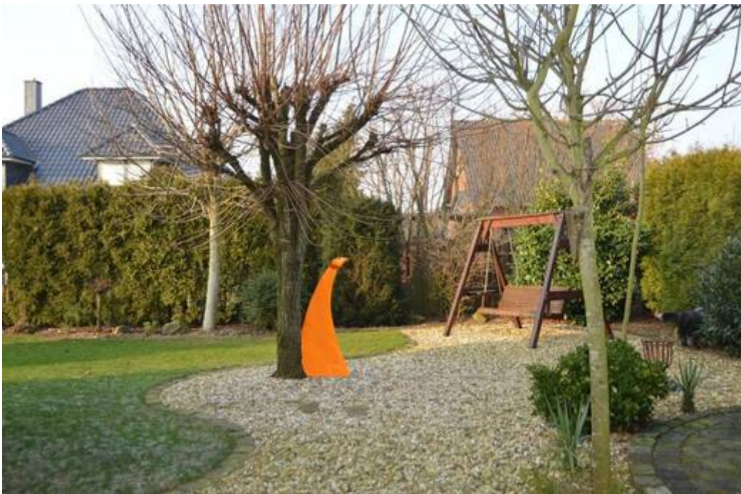
Profi-Garten mit Erholungswert