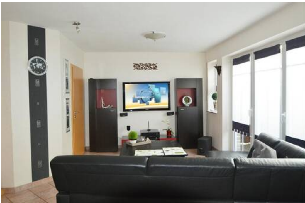
Wohnbereich mit bodentiefen Fensterpartien