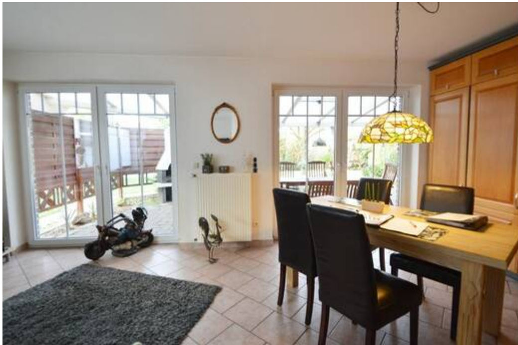
Essbereich mit Platz für einen Familientisch