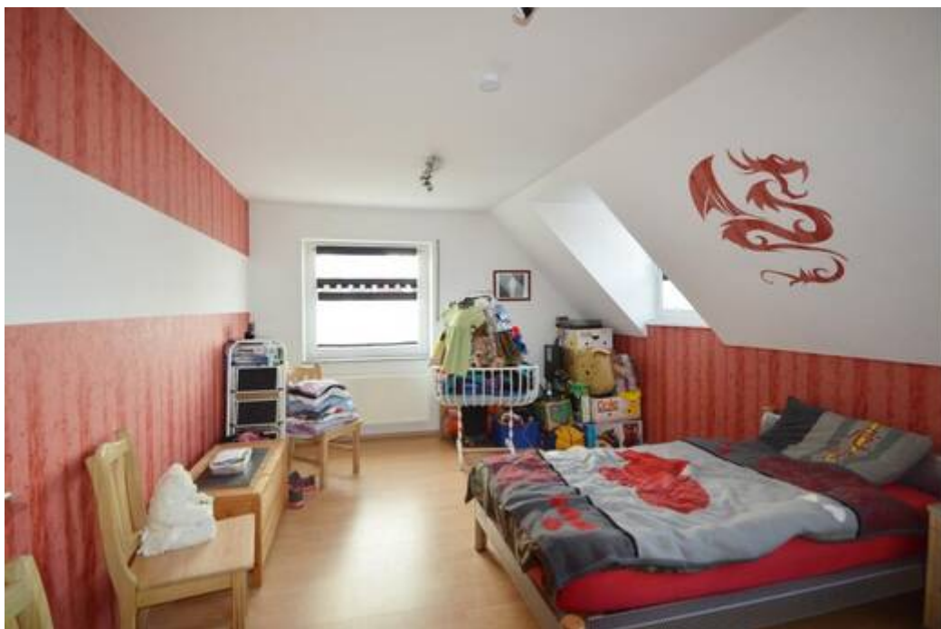
DG: Drei Fenster im ersten Kinderzimmer