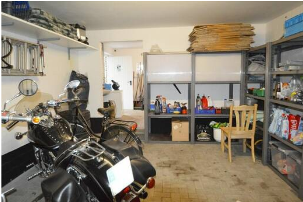
Große Garage mit angrenzenden Hobbyraum