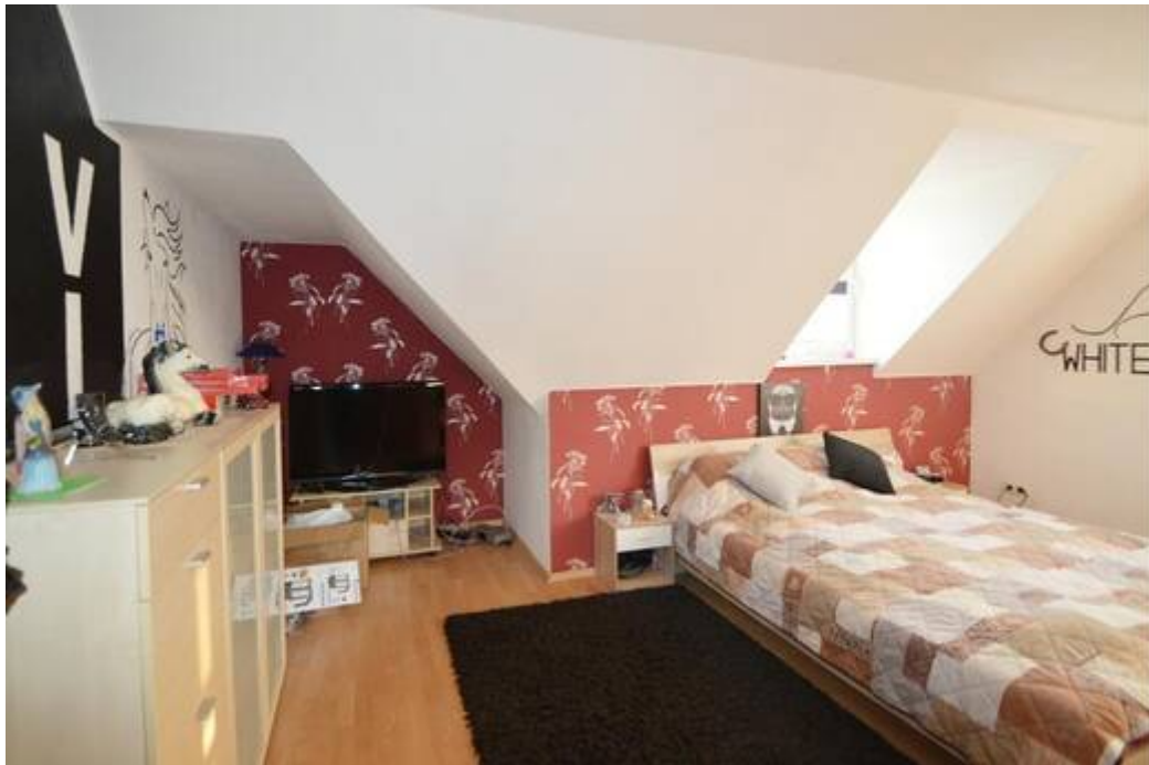
DG: Gemütliches Schlafzimmer