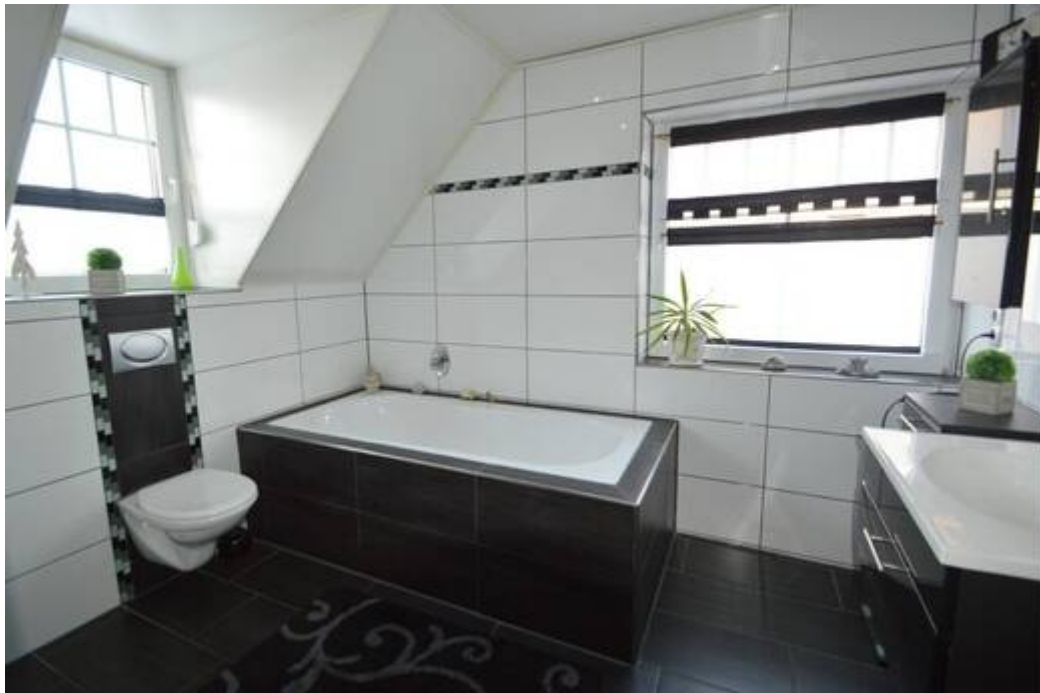
DG: Glücks-Oase mit Badewanne